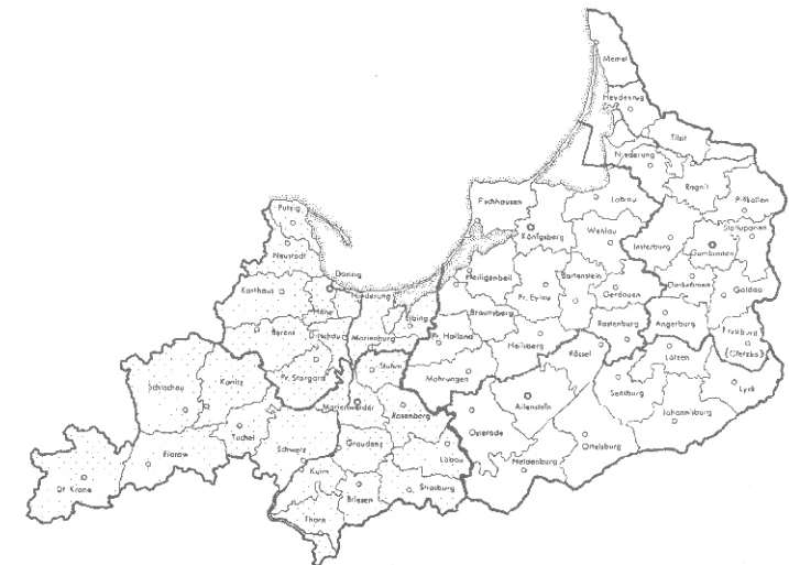
Ost- und Westpreußen 1905